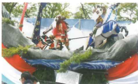
両町区大人船 「血戦 川中島」