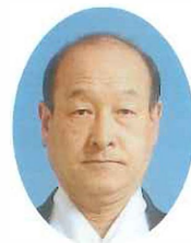
保尊勉宮司代務者 宮司に就任