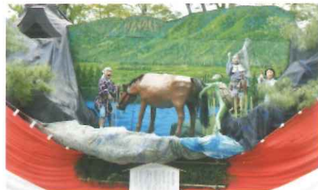
穂高区子供船 「万水川の河童」