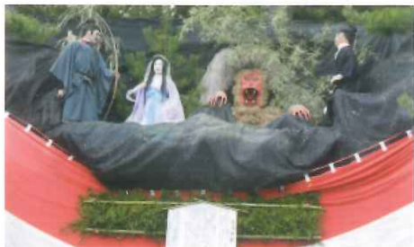
穂高区大人船 「猿鬼伝説」