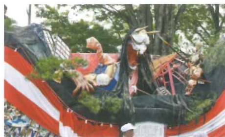
等々力町区子供船 「妖鬼 大江山」