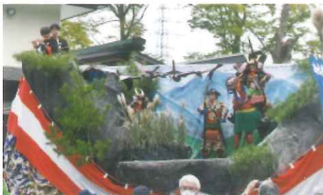
穂高町区子供船 「雁の乱飛で敵兵を知る」